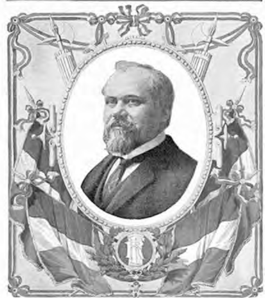
Le nouveau Président de la République M. RAYMOND POINCARE

Lors de l'assemblée générale de 1912 du tout jeune Syndicat d'Initiative du Limousin, ses élus décident d'organiser pour l'année suivante une grande manifestation ayant pour but la promotion de notre région.